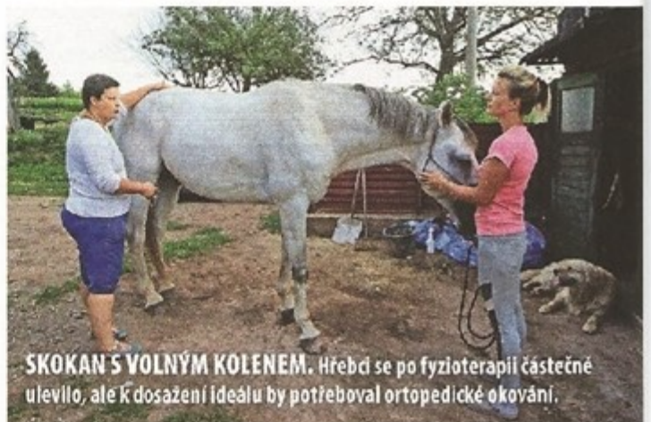
SKOKAN S VOLNÝM KOLENEM. Hřebec se po fyzioterapii částečně ulevilo, ale k dosažení ideálu by potřeboval ortopedické kování.

Začíná diagnostikování. Majitelka se s koněm projde po rovné cestě do mírného kopečka. Jednou, dvakrát... Jednou se